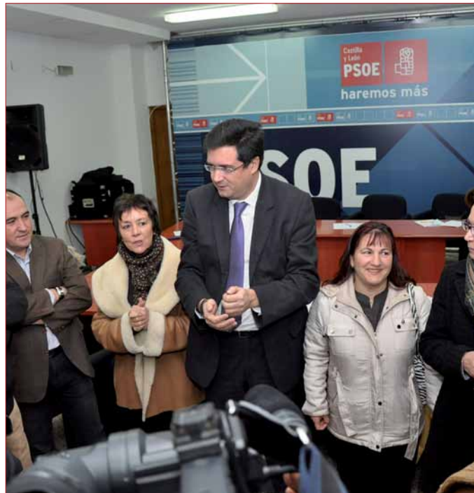
El Secretario General del PSCyL. Óscar López en un momento de la reunión.

Después López reiteró el "fraude electoral masivo" que supone para los ciudadanos los recortes puestos en marcha en Castilla y León, puesto que no solo no anunciaron estas medidas en el programa electoral sino que ni siquiera dijeron nada en sus discursos de investidura. "Son medidas que van en contra de los ciudadanos porque menoscaban la calidad de los servicios públicos y no ayudan a